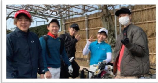
【スナッグゴルフ教室】 日本福祉大学ゴルフ部